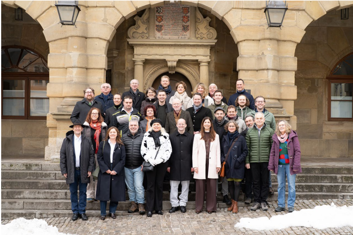
Parteiübergreifend Kreistagskandidierende Rothenburg und Umgebung stehen auf den Stufen vor dem Rothenburger Rathaus